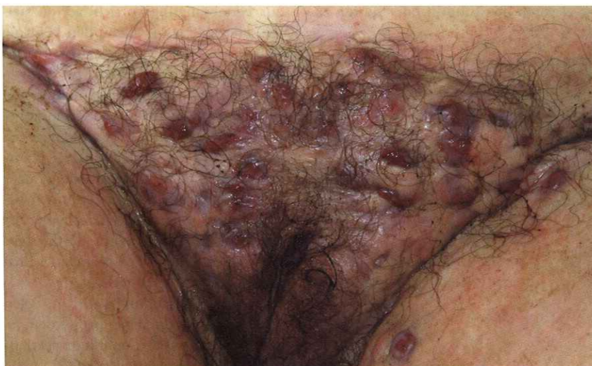
Abb. 3: Flächenhafter Befall der Schamhaar- und Leistenregion mit sekretierenden Knoten und Fistelung bei 28-jähriger Patientin (Hurley Stadium III)

Die Hidradenitis suppurativa ist eine oft nicht oder erst spät erkannte Erkrankung. Da die Läsionen mit ungenügender Hygiene assoziiert werden und mit Schamgefühlen belegte Regionen betreffen, haben die Patienten oft Hemmungen, ihre Beschwerden einem Arzt anzuvertrauen. Die Patienten leiden oft sehr stark auch unter einem objektiv geringen Befall.