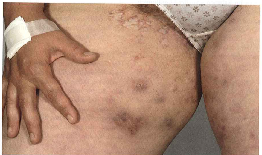
Abb. 2: Multiple entzündete Knoten am Oberschenkel und ausgedehnte Vernarbung in der Leistenregion bei 29-jähriger Patientin (Hurley Stadium II)